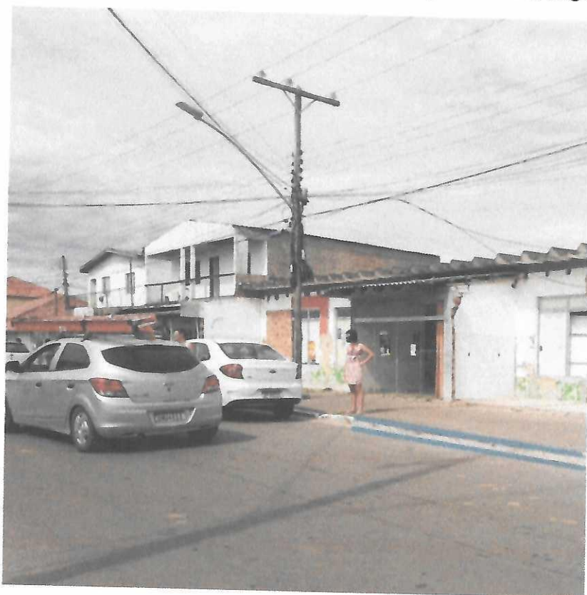
Av. Luciana de Abreu, esquina com General Câmara