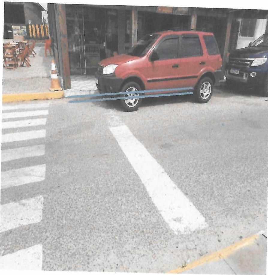
Av. General Osório, em frente ao palco central