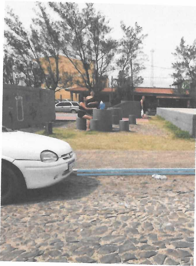
Rua João Guimarães Chiden, ao lado da pista de Skate