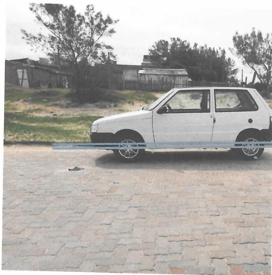
Av. Atlântico esquina com Av. Liberato Salzano Vieira da Cunha