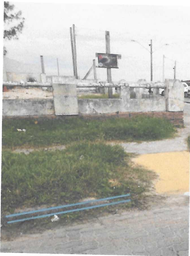
Rua Carlos Cazaletti Filho, esquina Av. Marechal Castelo Branco