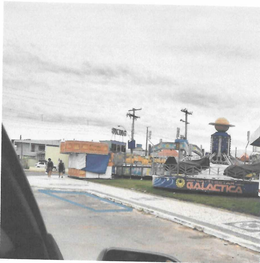
Na avenida General Osório, esquina Marechal Castelo Branco - estacionamento lateral ao parque