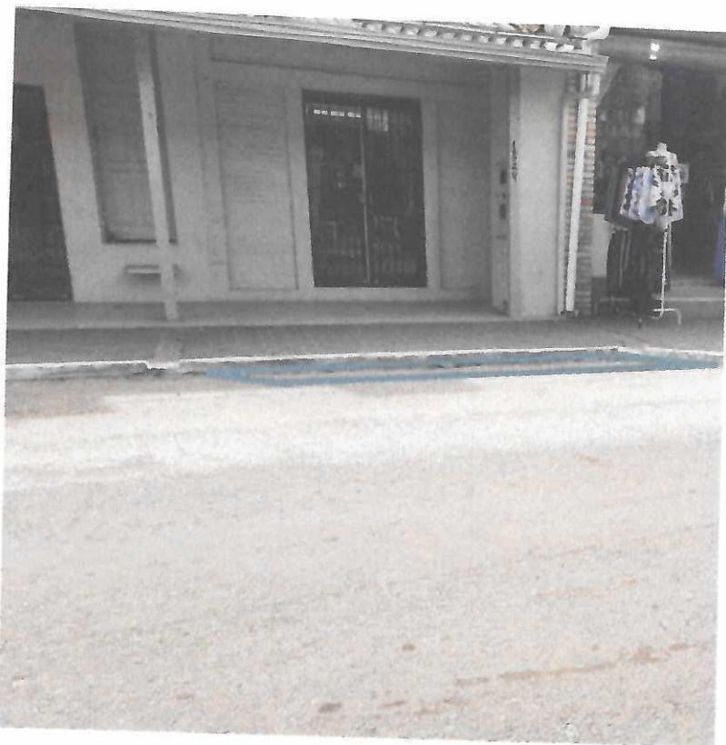
Av. Luciana de Abreu, estacionamento lateral, esquina com Av. Salgado Filho