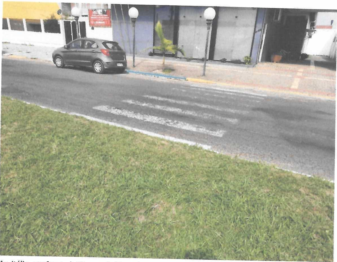
Av. Itália, em frente à Câmara de Vereadores