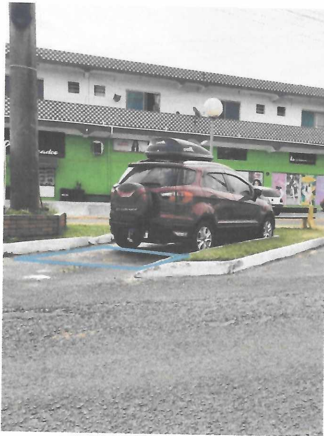
Av. Itália, esquina Marechal Castelo Branco, ao lado da farmácia Panvel no canteiro central