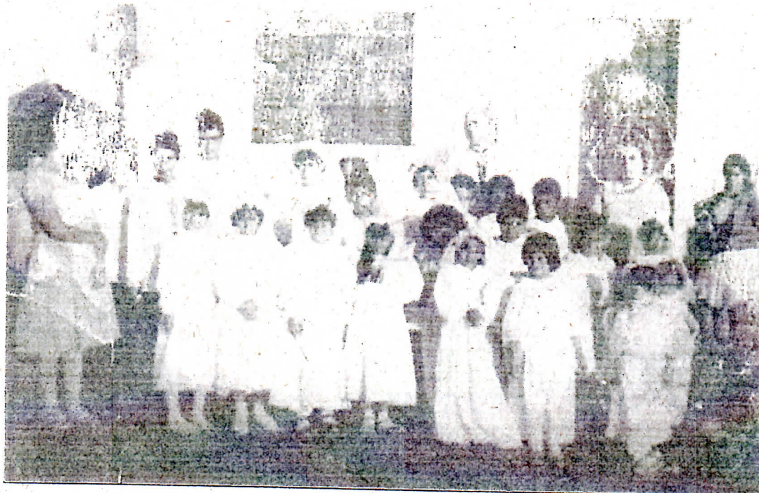
Catequese em 1962

Em 1982 fundou o primeiro clube de mães de Balneário Pinhal onde teve a frente por muitos anos.